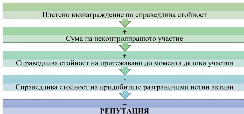
Фиг. 1 - Първоначална оценка на репутацията

В т. 1. Проблеми при оценяването на репутацията като специфичен отчетен обект са разгледани въпросите и дискуссионните моменти, свързани с оценяването на репутацията при първоначалното ѝ признаване и в последствие при представянето ѝ във финансовия отчет на предприятието. Параграф 1.1. Оценка на репутацията при първоначално признаване според приложимите счетоводни стандарти акцентира върху анализа на елементите, които стоят в основата на определянето на стойността на репутацията при първоначалното ѝ признаване. Самото определяне на първоначалната стойност на репутацията е представено със следната фигура: