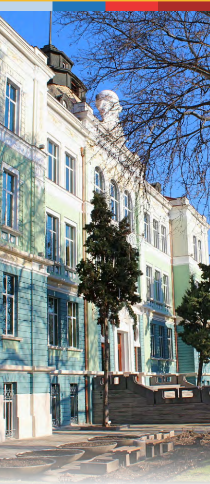
Основное здание Экономического университета – Варна