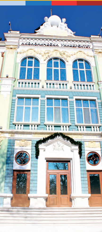
Современная высокотехнологичная среда