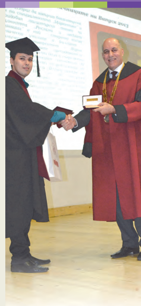
Graduation ceremony at University of Economics - Varna

Библиотека при Экономическом университете-Варне реновирована на средства европейской программы, и сегодня она является одной из самых современных библиотек в стране: объем книжного фонда насчитывает свыше 350 тысяч единиц, служба абонемента и библиотечного обслуживания модернизирована и состоит из 3 читальных залов в общей сложности на 210 мест для чтения и 60 компьютерных мест. Библиотека располагает компьютерным терминалом для людей с нарушением зрения, а также круглослойной системой для возврата книг.