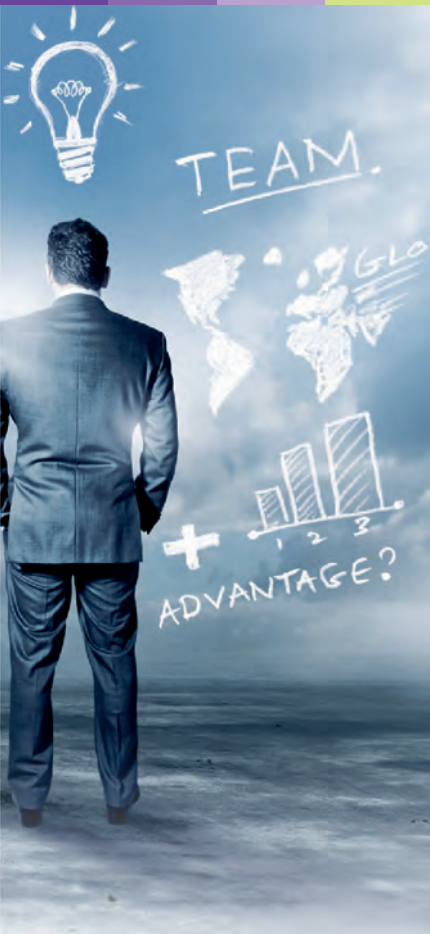
Partners / Партнеры

🇬🇧 With the goal of providing our students with better career opportunities after graduation, we have developed and strengthened partnerships with local and international businesses.