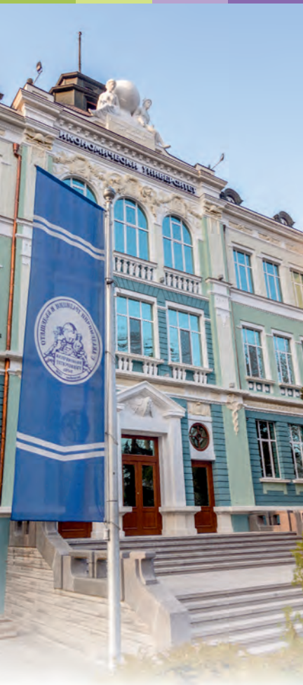
Main campus of University of Economics -Varna